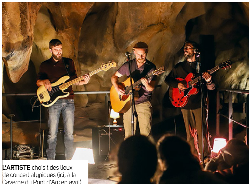
L'ARTISTE choisit des lieux de concert atypiques (ici, à la Caverne du Pont d'Arc en avril).

En tournée à vélo jusqu'au 27 mai, puis en tournée classique dans toute la France jusqu'au 23 novembre 2018.